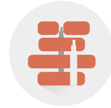
Sıva Altı Ve Üstünde Above And Below Plaster Под И Над Штукатуркой