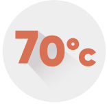
Maksimum Çalışma Sıcaklığı Maximum Operating Temperature Максимальная Рабочая Температура