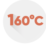
Kısa Devre Sıcaklığı Short Circuit Temperature Температура Короткого Замыкания