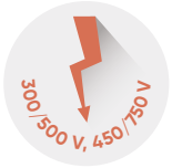
Anma Gerilimi Rated Voltage Номинальное Напряжение